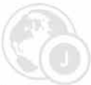
Sistemi di chiusura