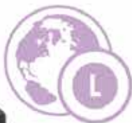
Galletti e Tiranti